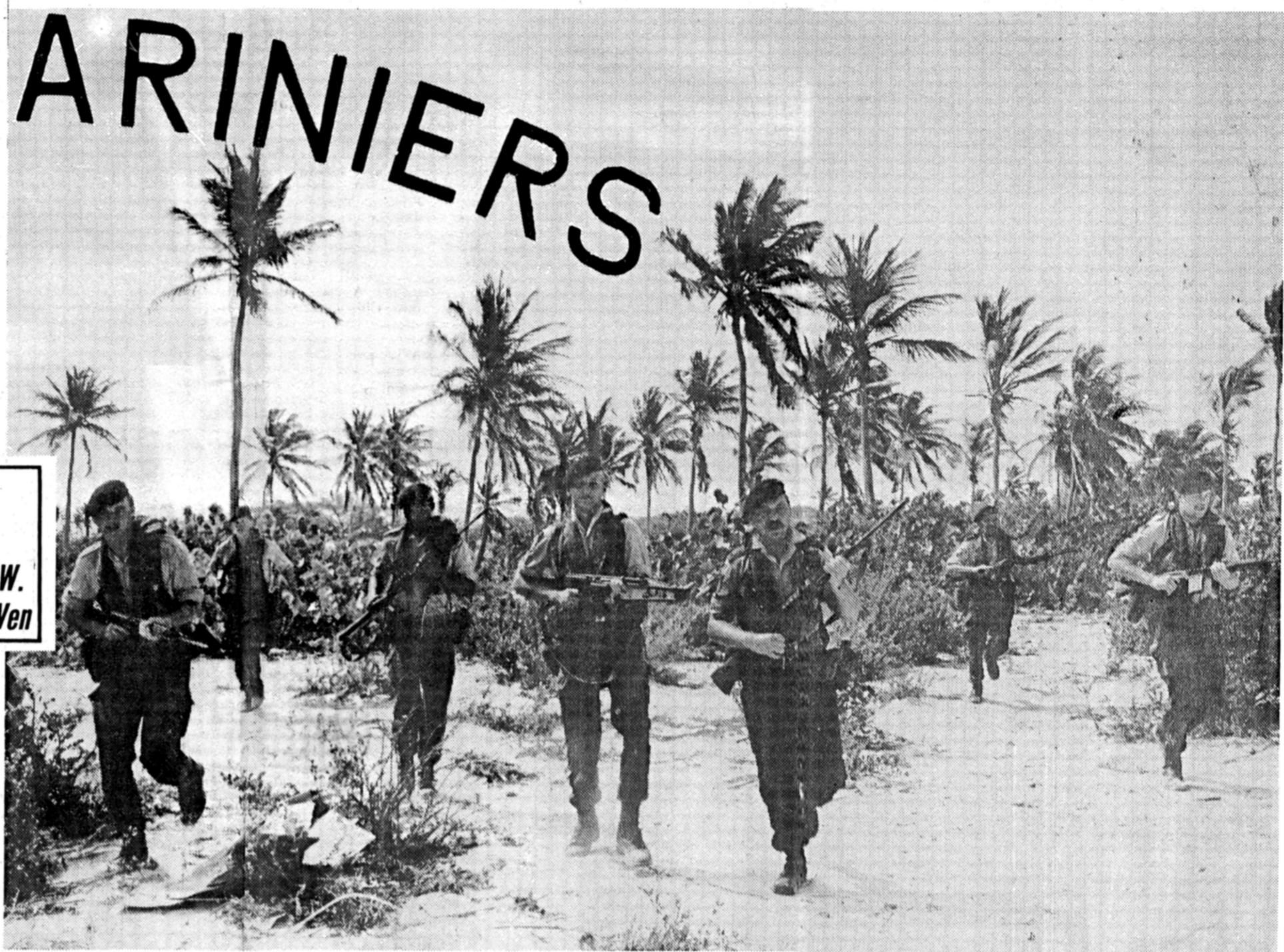
• Nederlandse mariniers aan het „bikkelen” onder de Arubaanse tropenzone.