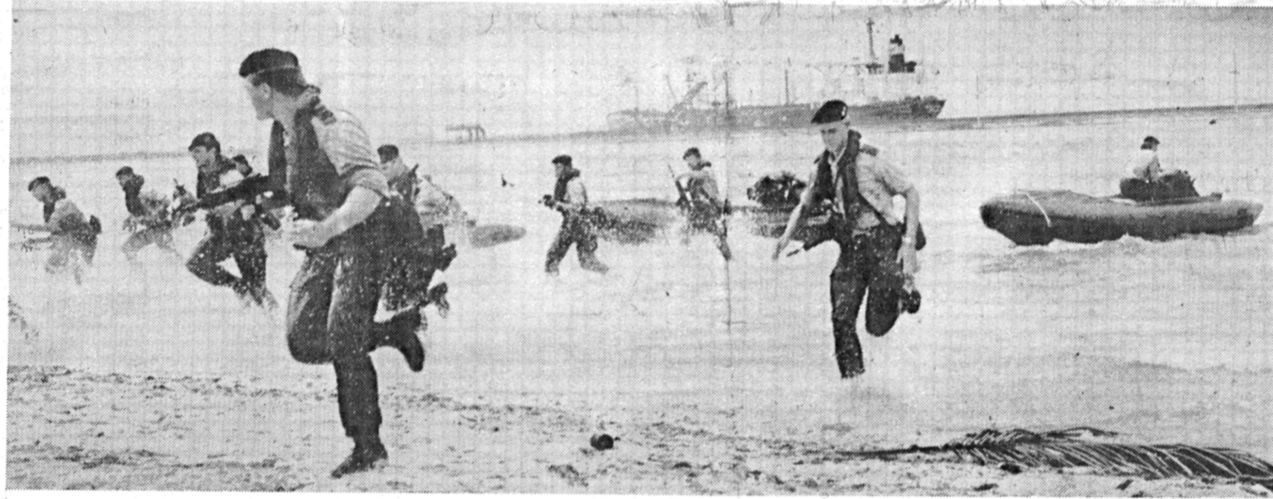
• Een landing van de mariniers vlakbij de grote olieraffinerij Lago.

plaatsvonden met de Amerikaanse mariniers op Puerto Rico en de Franse para-commando's op Martinique.